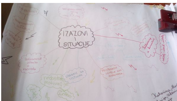
Radovi s radionice