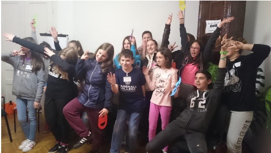
Djeca iz Osnovne škole Ivan Goran Kovačić na radionici koja se održala 7. ožujka 2017.

gore i ravnopravno sudjelovanje svih dionika zajednice učenja. Izazov za nas kao voditelje bio je pripremiti proces i materijale koji bi bili razumljivi i prikladni i za odrasle i za djecu.